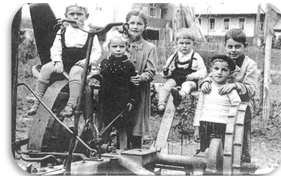
Aufnahme: Anfang 40-er Jahre